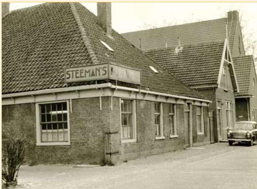
Het pand van Steeman's Kolenhandel aan de Overtoom.