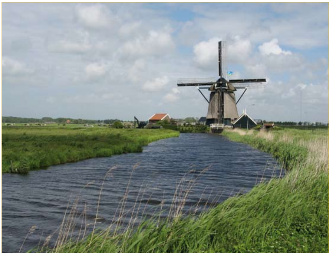
De Noordermolen in de Groot-Limmerpolder.