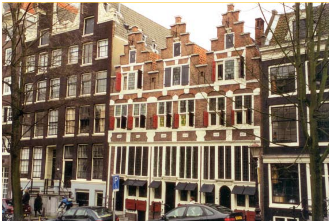
Een pand aan de Bloemgracht te Amsterdam bestaande uit 3 identieke huizen, luisterend naar de namen 'De Steeman', 'De Landman' en 'De Zeeman'.