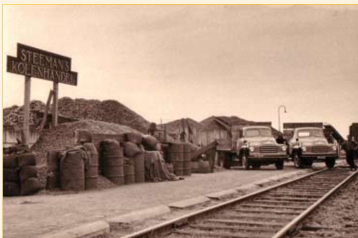
De steenkolenopslag achter het station van Castricum

De ontdekking in 1959 bij Slochteren van enorme hoeveelheden aardgas bracht grote veranderingen in de brandstoffenhandel. Niek Steeman had een vooruitziende blik, hij behaalde de nodige diploma's om een nieuwe richting met zijn bedrijf in te slaan. Hij startte naast de brandstoffenhandel in het pand aan de Overtoom ook een toonzaal waar haarden en kachels werden verkocht en er werd een Avia-pomp naast het pand geplaatst voor de verkoop van benzine. Vanaf