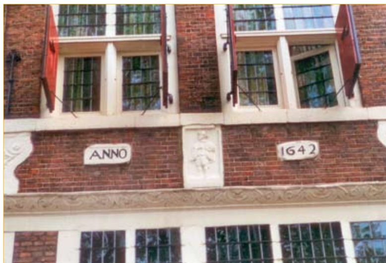
Gevelsteen 'De Steeman'.