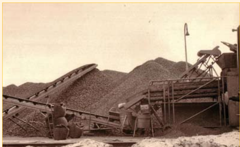
De verwerking van kolen achter het station.