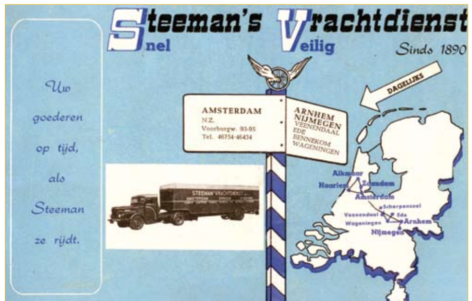
Brochure Steeman's Vrachtdienst